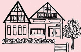
Martin-Luther-Gemeindehaus Eppinger Str. 152

Erstklässlerjungschar LGH Freitags - 15:00 bis 16:30 Uhr